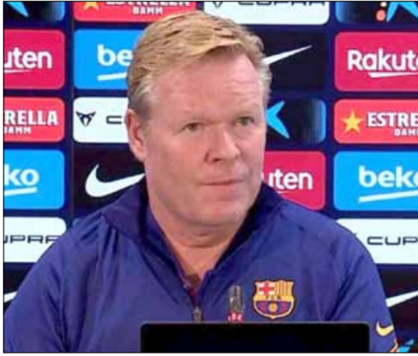
فورتونا سبتار في الدوري الهولندي: «كيف يفترض بي أن أرد على تلك الكلمات؟، ما علاقتي أنا بكل ذلك؟». وأضاف: «أنا أعلم الآن بشكل جيد

مع أياكس، لا أعرف كل شيء عن تلك الشائعات، لن نتحدث فقط عن هذه المباراة. وفي سياق متصل أشارت تقارير إلى أن كومان سيحصل على تعويض كبير في حالة إقالته، وهو ما يثير الشكوك حول قدرة برشلونة على تغيير المدرب في الوقت الحالي. وكان من المقرر أن يواجه كومان وسائل الإعلام يوم الأربعاء للحديث عن المباراة المقررة (الخميس الماضي) أمام قادش وقد رفض المدرب الهولندي الإجابة عن الأسئلة وقرأ بياناً مكتوباً، دعا من خلاله جماهير برشلونة بالتخلي بالصبر وأكد أنه يحظى بدعم الإدارة. وقال كومان في البيان: صباح الخير