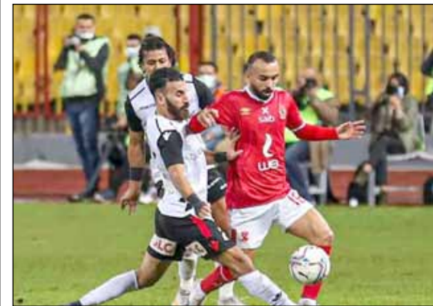
فشل الأهلي حامل لقبسي الدوري والكأس لموسم 2019-2020 في زيادة غلته من الانتصارات ليتجمد رصيده عند 11 لقباً. وسعى الأهلي إلى تعويض