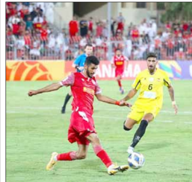
على أن تقام المباراة النهائية تشرين الثاني على أرض ممثل للبطولة على العموم في 25 الغرب.