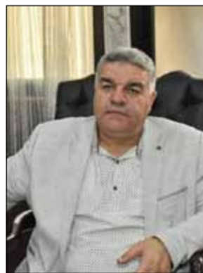
محي الدين دولة