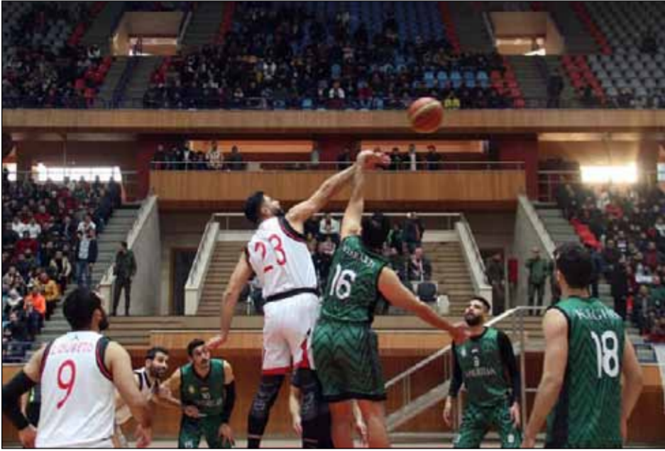
ترتيب دوري الدرجة الأولى للرجال.. الأسبوع السابع عشر