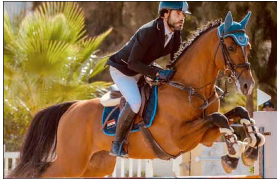
لفنس الفئة وجاء شاهين في وانطلقت أمس (الجمعة) الجولة الثانية من البطولة بمشاركة فرساننا وتختتم مساء اليوم (السبت).

أحرز فرسان منتخبنا الوطني لقفز الحواجز مراكز متقدمة في الجولة الأولى من بطولة عياد الدولية، التي أقيمت مبارياتها على مدى يومين في ميدان نادي الجواد العربي في الأردن بمشاركة واسعة من فرسان منتخبات، مصر، اليابان، فلسطين، سورية، العراق، هولندا، الأردن.