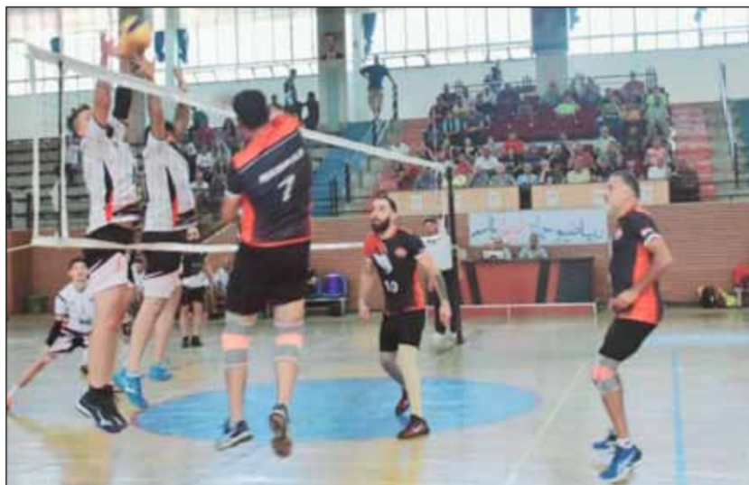
ونقطة لصالحه وبصعوبة 28 / 26. الشوط الثاني

في حماة وعلى أرض صالة الشهيد ناصح علواني كان لقاء القمة المبكرة بين سلمية وضييفه القطيفة حامل اللقب وكان أكثر حرارة وفعالية وندية وإثارة بذل فيها الفريقان جهود مضاعفة من أجل مواصلة مشوار المنافسة الحقيقية على بطولة الدوري خاصة من جانب القطيفة الفائز ذهاباً 3 / 1 ويريد أن يجدد فوزه ليدخل مباراته مع الشرطة مع نهائي الإياب بلا أية خسارة لكن جرت الرياح بما لا تشتهي السفن فتعرض لأول خسارة هذا الموسم أمام ضيفه سلمية الذي رد اعتباره لخسارته ذهاباً وحقق فوزاً