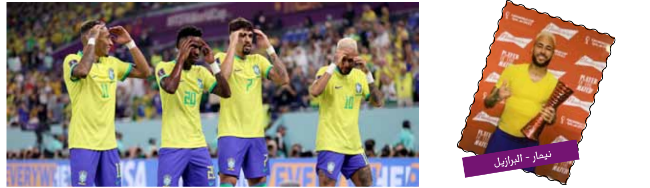
نيمار - البرازيل

من نيمار، راوغ بها المدافع وأطلق تسديدة بدمه اليمنى لكن سونج أبعدها لركنية. وفي الدقيقة 68، أنفذ اليسون فرصة محققة بعد عرضية مرت من الجميع لتجد هوانج هي تشان، الذي أطلق تسديدة صاروخية تألق فيها اليسون ليبعدها عن مرامه. ونجح المنتخب الكوري في تقليص النتيجة بالدقيقة 76 عن طريق سونج هو، الذي شارك كبديل في الشوط الثاني، فمن ركلة حرة نفذت داخل المنطقة شتتها الدفاع البرازيلي لتصل إلى سونج الذي أطلق قذيفة صاروخية من خارج المنطقة سكنت يسار الحارس اليسون. وبعد دقيقتين، أنفذ اليسون فرصة الهدف الثاني لكوريا بعد كرة طويلة في عمق الدفاع البرازيلي، انفرد بها تشو وأطلق تسديدة أبعدها اليسون إلى ركنية، لكن حكم المباراة أشار لوجود حالة تسلل على المهاجم. ومن عرضية من الناحية اليسرى من مارتينيلي لأقصى الناحية اليمنى، كاد داني أفسس أن يحرز هدفاً جميلاً بالدقيقة 89، بعدما قابل العرضية بتسديدة مقصية على الطائر لكنها ضربت بالمدافع هونج وخرجت لركنية، لينتهي اللقاء بانتصار البرازيل 2 - 1.