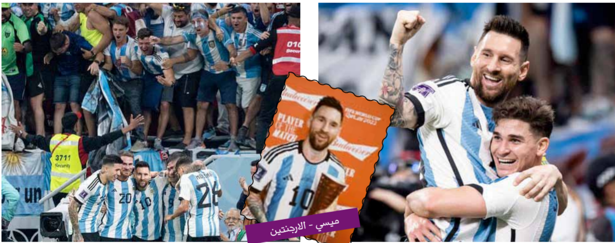
ميسي - الأرجنتين