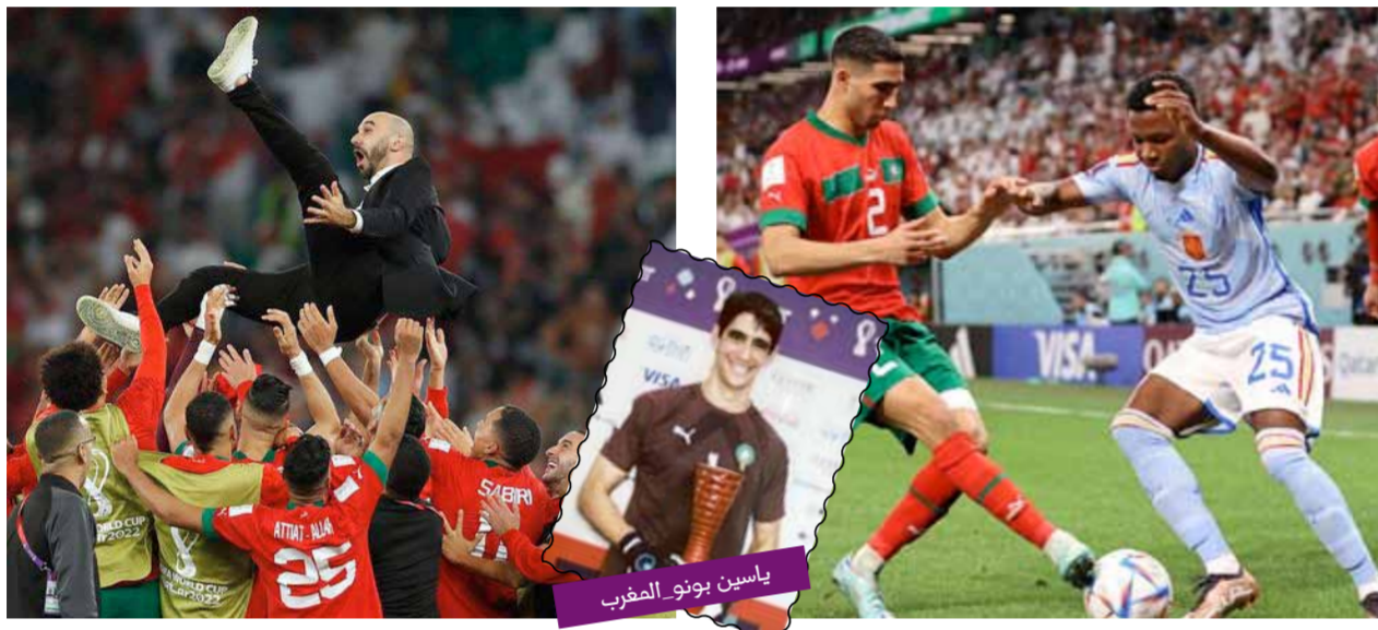
ياسين بونو المغرب

لينطق ويسدد كرة مرت بجانب القائم الأيمن لمرمى ياسين بونو في الدقيقة 81. واشتكى نايف أكرد مدافع المغرب من إصابة عضلية، ولم يستطع استكمال المباراة، ليضطر وليد الركراكي المدير الفني لأسود أطلس لاستبداله بجواد اليايقي في الدقيقة 84. وانتهى الوقت الأصلي بالتعادل السلبي بدون أهداف، ليتم اللجوء للأشواط الإضافية. وأضاع وليد شديدة أخطر فرصة للمغرب لتسجيل هدف التقدم في الدقيقة 103، حيث تلقى تمريرة بينية من زميله أوناحي لينفرد بالحارس أوناي سيمون الذي تصدى للكرة بقدمه. وانتهت الأشواط الإضافية بالتعادل السلبي، ليتم الاتجاه لركلات الترجيح. وسجل للمغرب عبد الحميد صابري وحكيم زياش وأشرف حكيمي وأهدر فقط بدر بانون، أما إسبانيا فلم تسجل أي كرة حتى أهدر كل من بابلو سارابيا وكارلوس سولر وبوسكيتس.