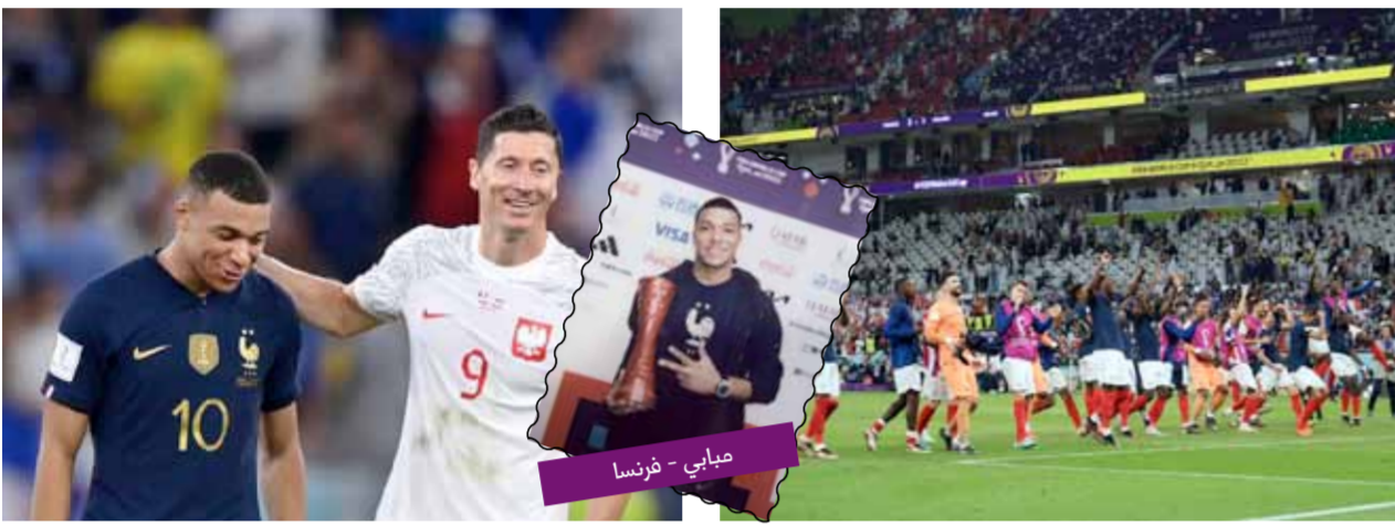
مبابي - فرنسا

واصل منتخب فرنسا حملة الدفاع عن لقب كأس العالم، بالفوز على بولندا بثلاثية لهدف، يوم الأحد الماضي، ليتأهل الديوك لدور الثمانية ومن بوابة إنكلترا اليوم السبت يسعون للإستمرار أو الوقوف عند هذا الحد. سجل أوليفيه جيرو وكيليان مبابي «ثنائية» في الدقائق 44 و 74 و 91 بينما سجل روبرت ليفاندوفسكي المرمى الخالي من حارسه البولندي، وذلك بعد تمريرة عرضية من ديمبلي. المحاولات البولندية كانت قليلة، لكنها بالغة الخطورة، حيث سدد ليفاندوفسكي كرة قوية بجوار القائم، بينما أنقذ هوجو لوريس مرماه من هدف محقق أمام تسديدة زلينسكي من داخل منطقة الجزاء. ارتدت نفس الهجمة للمهاجم البولندي كامبينسكي ليسدد كرة أبدها الدفاع الفرنسي من على خط المرمى، بخلاف محاولة أخرى لنفس اللاعب في الشباك من الخارج، وترجم الديوك الأفضلية بهدف في الثواني الأخيرة من الشوط الأول، سجله جيرو ليصبح الهدف التاريخي لمنتخب فرنسا، مستفيداً من تمريرة كيليان مبابي. حاول المنتخب الفرنسي تعزيز تفوقه بهدف ثانٍ مبكر في الشوط الثاني، ووصل إلى مرمى بولندا بأكثر من محاولة خطيرة لجريزمان وجيرو وكيليان مبابي. امتص منتخب بولندا الحماس الفرنسي، وبدأ مديره الفني في تشييط الصفوف تدريجياً سعياً لإدراك هدف التعادل، حيث شارك ميليك وزاليسكي وبيليك مكان كريشوفيك وسزيماسكي وكامبينسكي. اندفع رفاق ليفاندوفسكي هجومياً، وتركوا المساحات واسعة في الهجمات المرتدة، لينطلق عثمان ديمبلي بالكرة ويمررها إلى مبابي،