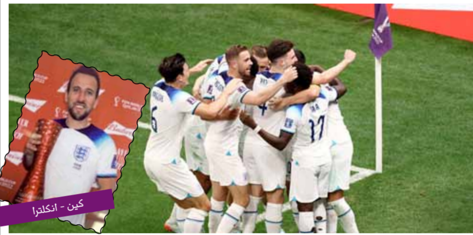
كين - إنكلترا

شباب الحزب أداء الفريقين في النصف الأول من الشوط الأول، ولم تشهد الدقائق الأولى فرصاً خطيرة، باستثناء ثغرة وجهها مهاجم السنغال بولاي ديا، الذي راوغ هاري ماجواير وجون ستونز، لكن الأول عاد ليقتله منه الكرة في الدقيقة الرابعة. كانت السنغال الأخطر بعد اعتمادها على الهجمات المرتدة التي لم تثمر، ونفذ الإنكليزي فيل فودين ركلة ركنية، تابعها زميله جون ستونز رأسية بعيداً عن المرمى في الدقيقة 20. وكادت السنغال تفتتح التسجيل في الدقيقة 23، عندما فشل بولاي ديا في استئثار عرضية دياتا، لكن الكرة استقرت أمام إسماعيل سار الذي تابعها من مسافة قريبة عالياً فوق المرمى. وواصلت السنغال خطورتها، حيث استقرت تمريرة سار عند ديا الذي