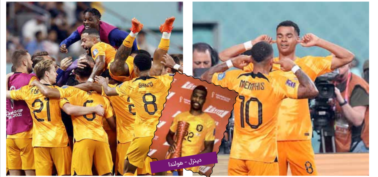
دينزل - هولندا

فان جال هجمة سريعة انتهت بتمريرة عرضية من دومفريس إلى ديباي داخل منطقة الجزاء، ليقابلها بلمسة خاطفة، استقرت داخل الشباك، لتتقدم الطواحين بهدف مبكر. وعاد ديباي لتهديد مرمى الحارس الأمريكي تيرنز بتسديدة قوية، لكنها أخطأت طريقها ومرت إلى خارج الملعب. المنتخب الأمريكي واصل محاولاته على مرمى تيرنز، سعياً نحو التعادل، لكن الحارس الهولندي صمد مجدداً أمام تسديدة قوية من تيموثي وبا. وفي اللحظات الأخيرة من الشوط الأول، عادت هولندا لمباغثة أمريكا بهدف ثانٍ بذات الطريقة، لكن هذه المرة عبر بليند، الذي حاكى تسديدة ديباي في الهدف الأول، بعد تمريرة من دومفريس أيضاً. بداية الشوط الثاني كادت تشهد هدف التقليل من أمريكا عن طريق تيم ريم، لكنه أهدر الفرصة بفرطه. وكانت هولندا على مقربة من إطلاق رصاصة الرحمة على المنتخب الأمريكي بعد كرة عرضية ارتطمت بلمسة خاطفة، لتتحول بالخطأ نحو مرمى الطواحين بهدف مبكر. وعاد ديباي لتهديد مرمى الحارس الأمريكي تيرنز بتسديدة قوية، لكنها أخطأت طريقها ومرت إلى خارج الملعب. المنتخب الأمريكي واصل محاولاته على مرمى تيرنز، سعياً نحو التعادل، لكن الحارس الهولندي صمد مجدداً أمام تسديدة قوية من تيموثي وبا. وفي اللحظات الأخيرة من الشوط الأول، عادت هولندا لمباغثة أمريكا بهدف ثانٍ بذات الطريقة، لكن هذه المرة عبر بليند، الذي حاكى تسديدة ديباي في الهدف الأول، بعد تمريرة من دومفريس أيضاً. بداية الشوط الثاني كادت تشهد هدف التقليل من أمريكا عن طريق تيم ريم، لكنه أهدر الفرصة بفرطه.