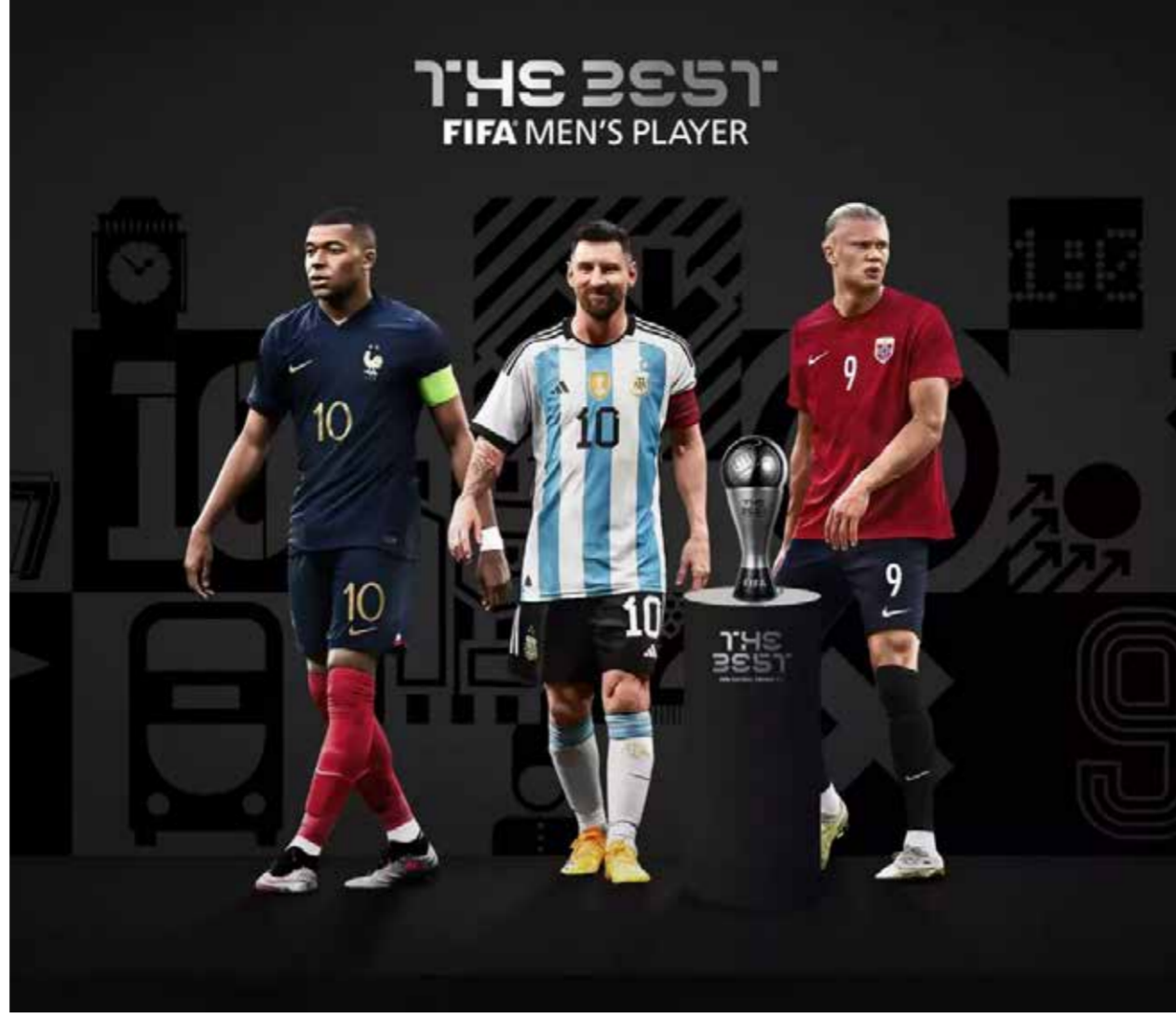
الدوري الإنجليزي الممتاز، وغالباً ما يُذكر أن ألف إنجي والد هالاند هو لاعب كرة قدم سابق، مثل النرويج ولعب على أعلى المستويات، ولكن والدته، جري مارييتا براوت، كانت أيضاً معروفة ببراعتها في الرياضة، حيث حصلت خلال التسعينيات على ألقاب في منافسات من جانبه، واصل مبابي تألقه

كشفت الاتحاد الدولي لكرة القدم (فيفا) يوم الخميس عن القائمة النهائية للمرشحين لجائزة أفضل لاعب في العالم لعام 2023. وضمت القائمة النهائية للمرشحين النرويجي إيرلينج هالاند هداف مانشستر سيتي والفرنسي كيليان مبابي هداف باريس سان جيرمان والأرجنتيني ليونيل ميسي نجم إنتر ميامي الأمريكي. وسيتم الكشف عن هوية أفضل لاعبة في العالم خلال حفل الجوائز السنوي ليفيفا في 15 يناير 2024 في لندن. تُمنح الجائزة لأبرز اللاعبين أداءً على مستوى الرجال في الفترة من 19 ديسمبر 2022 وحتى 20 أغسطس 2023. وجرى ترشيح 12 لاعباً في البداية لجائزة أفضل لاعب في العالم من فئة الرجال، بعد أن تم اختيارهم من قبل لجنة من الخبراء، ومن هذه القائمة المختصرة، تم اختيار المتأهلين للتصفيات النهائية من قبل لجنة تحكيم دولية تتألف من: مدربي المنتخبات الوطنية للرجال، وقادة المنتخبات الوطنية للرجال، وصحفيي كرة القدم التابعين للاتحادات الوطنية، والمعلقين الذين صوتوا عبر موقع فيفا الرسمي.