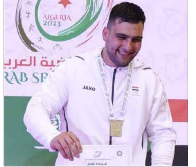
بانوراما الرياضة السورية 2023

بواقع (321 ذهبية - 318 فضية - 358 برونزية)